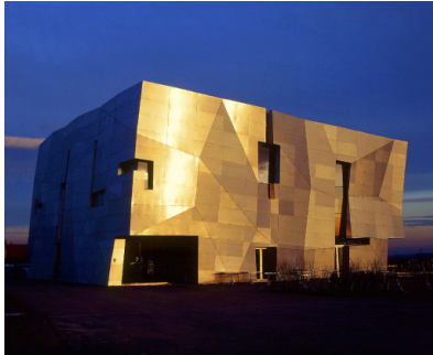
Loisium, Besucherzentrum geplant von Steven Holl