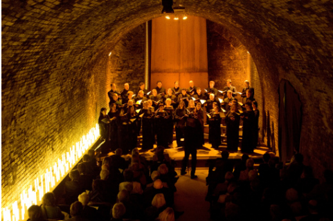
Arnold Schönberg Chor