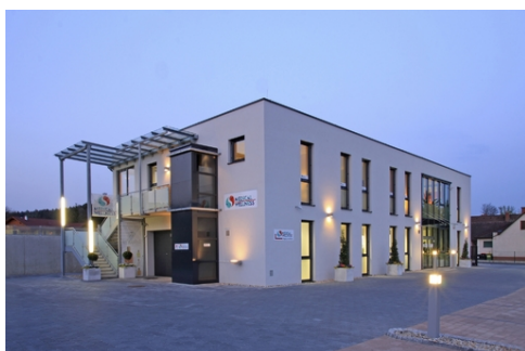
Medical Wellness Center