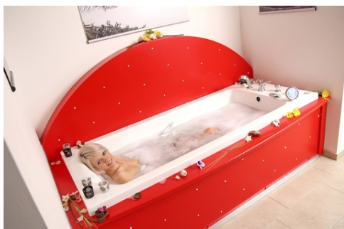
Wellnesswanne mit über 50 Massagedüsen