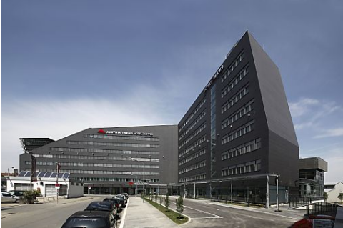
Beim T-Center: Austria Trend Hotel Doppio (l.) und die Doppio Offices (r.)