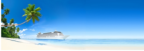
Kreuzfahrt-Träume von sab-cruises