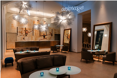
Motel One Wien Staatsoper Lounge