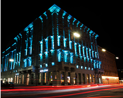
Motel One Wien - Staatsoper Fassade