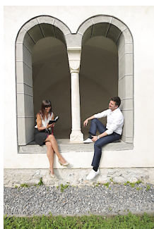
Liebespaar beim Schmökern in den Büchern der Liebe