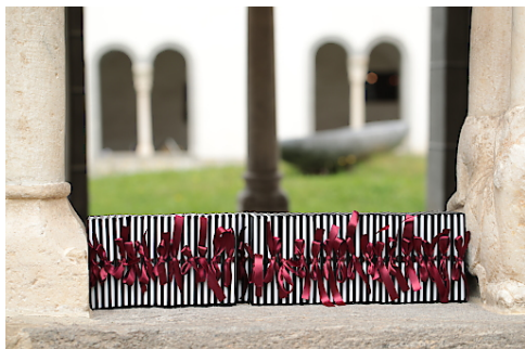
Bücher der Liebe im Stift Millstatt