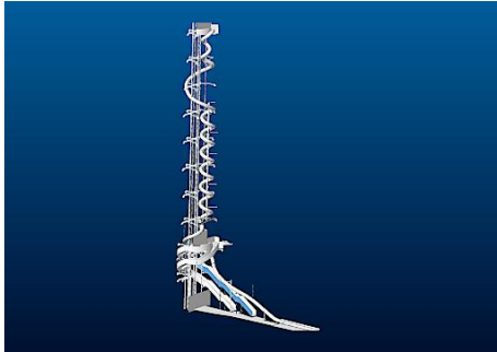
Schematische Darstellung der Schlossbergrutsche