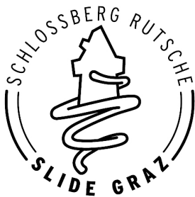
Logo der Schlossbergrutsche Graz