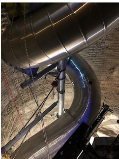
Baufortschritt der Schlossbergrutsche