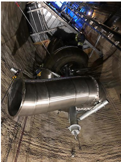
Baufortschritt der Schlossbergrutsche