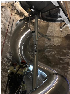
Baufortschritt der Schlossbergrutsche