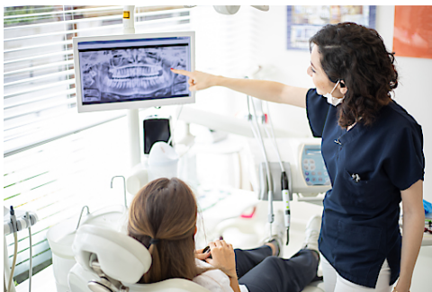
Besprechung beim Endodontologen