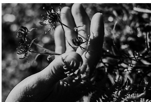
Die Natur spüren und Kraft tanken.