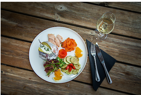
Ski Food Bad Kleinkirchheim: Hütten-Kulinarik mit Pfiff