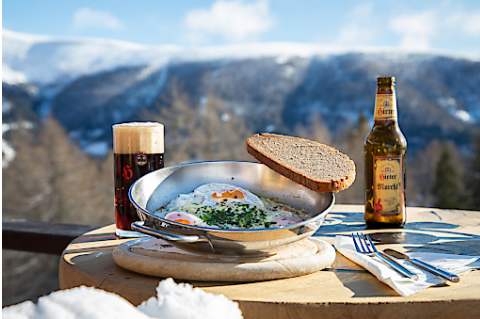
Ski Food Bad Kleinkirchheim: Hütten-Kulinarik mit Pfiff