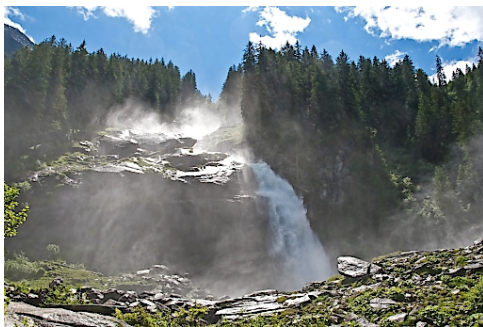
Krimmler Wasserfälle mit 380 Metern Fallhöhe