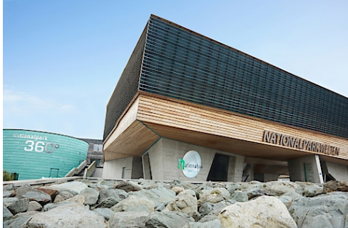
Die Nationalparkwelten Mittersill