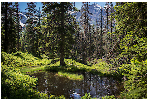
Rauriser Urwald im Raurisertal