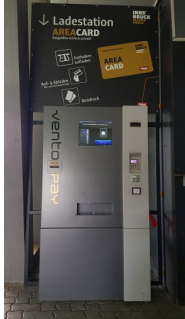
AREA CARD Gästekartenautomat im Tivoli Stadion Tirol