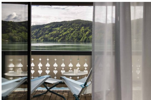
Blick vom Zimmer auf den See