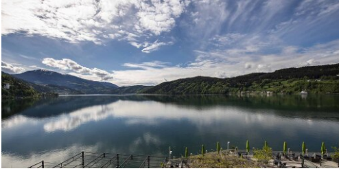
Seepanorama Hotel Forelle